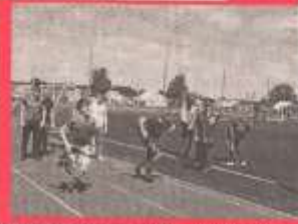
Инициаторы, две команды юнармистов и команда пионеров

Муниципальное поздравление для призывников подготовили вокалисты Дома культуры «Семан».